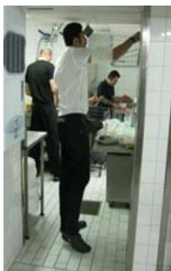
Maten förbereds i köket

I den nya lokalen på Mariehamngatan 24 är verksamheten nu i full gång och kunderna strömmar till i god omfattning. Flera av Pargas medlemmar har besökt Vanak. Bara goda omdömen har förmedlats från gästerna.