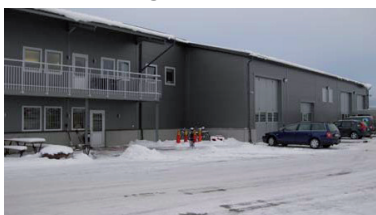
Beabs nya lokal i Bro

BEAB har länge varit hyresgäst i Pargas. Tidigare har BEAB haft dels lokalen mot gatan på Mariehamngatan 8, dels en kontorslokal på bottenvåningen i samma hus. Den förstnämnda lokalen har använts som pausrum och arbetsledningscentral för maskinförarna. I och med att verksamheten växt med åren har man blivit alltmer trångbodd.